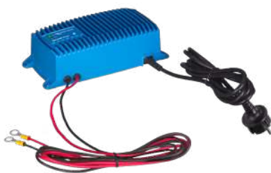
Chargeur Blue Smart IP67 12/25