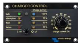
Tableau Charger Control'

Alarme visuelle et sonore en cas de tension batterie trop haute ou trop basse. Seuils de déclenchement réglables. Contact sec pour signalisation déportée.