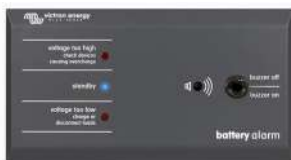
Tableau 'Battery Alarm'

Alarme visuelle et sonore en cas de tension batterie trop haute ou trop basse. Seuils de déclenchement réglables. Contact sec pour signalisation déportée.