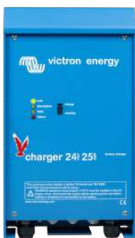
Chargeur 24 V 25 A