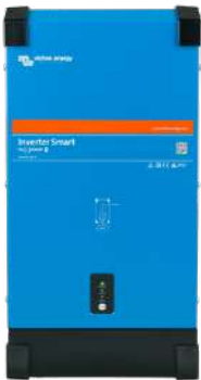
Convertisseur Smart 12/3000